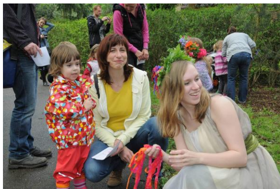
Pohádkový les dubem 2015