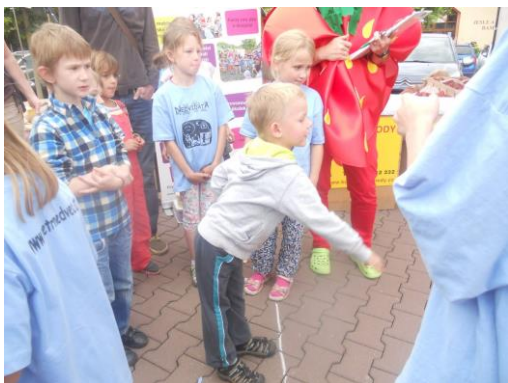
Jahodobraní červen 2015