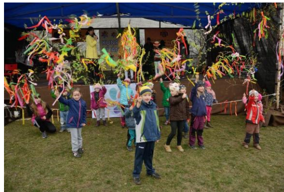
Vítání jara březem 2015