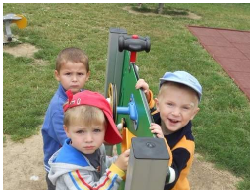
Dětská skupina léto 2015