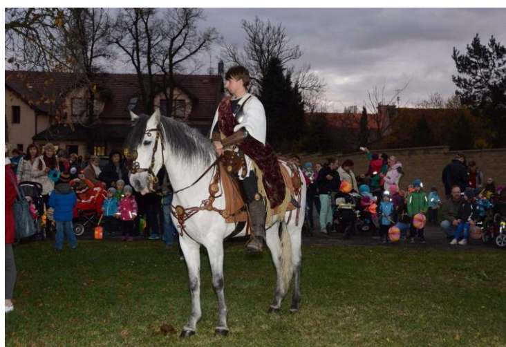
Svatomartinský průvod listopad 2015