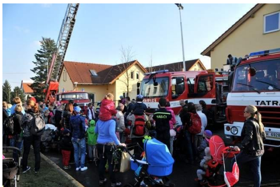
Návštěva hasičské zbrojnice březem 2015