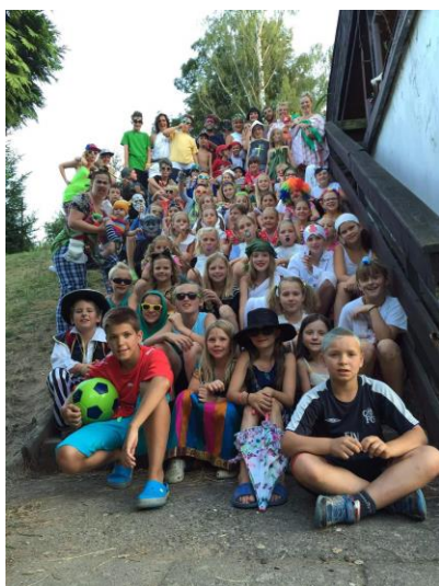
Tábor Želiv léto 2015